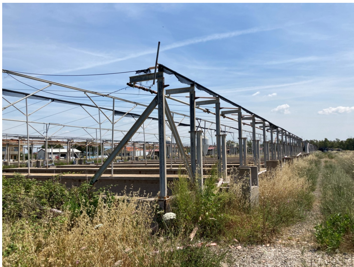
foto 12: vasche di allevamento in manutenzione (rif. 7) - vista da sud-ovest