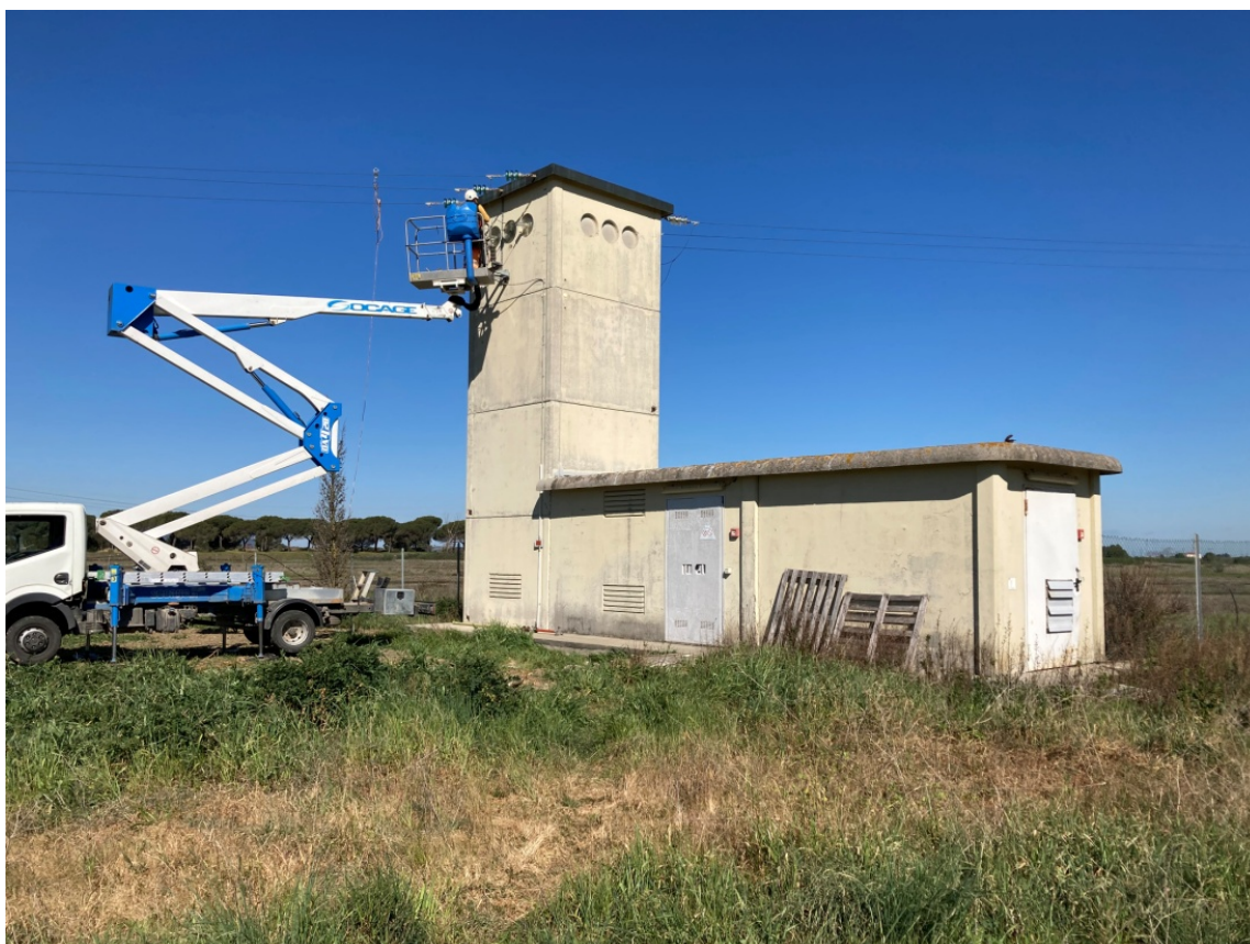
foto 10: cabina di trasformazione ENEL (rif. 6) - vista da sud-est