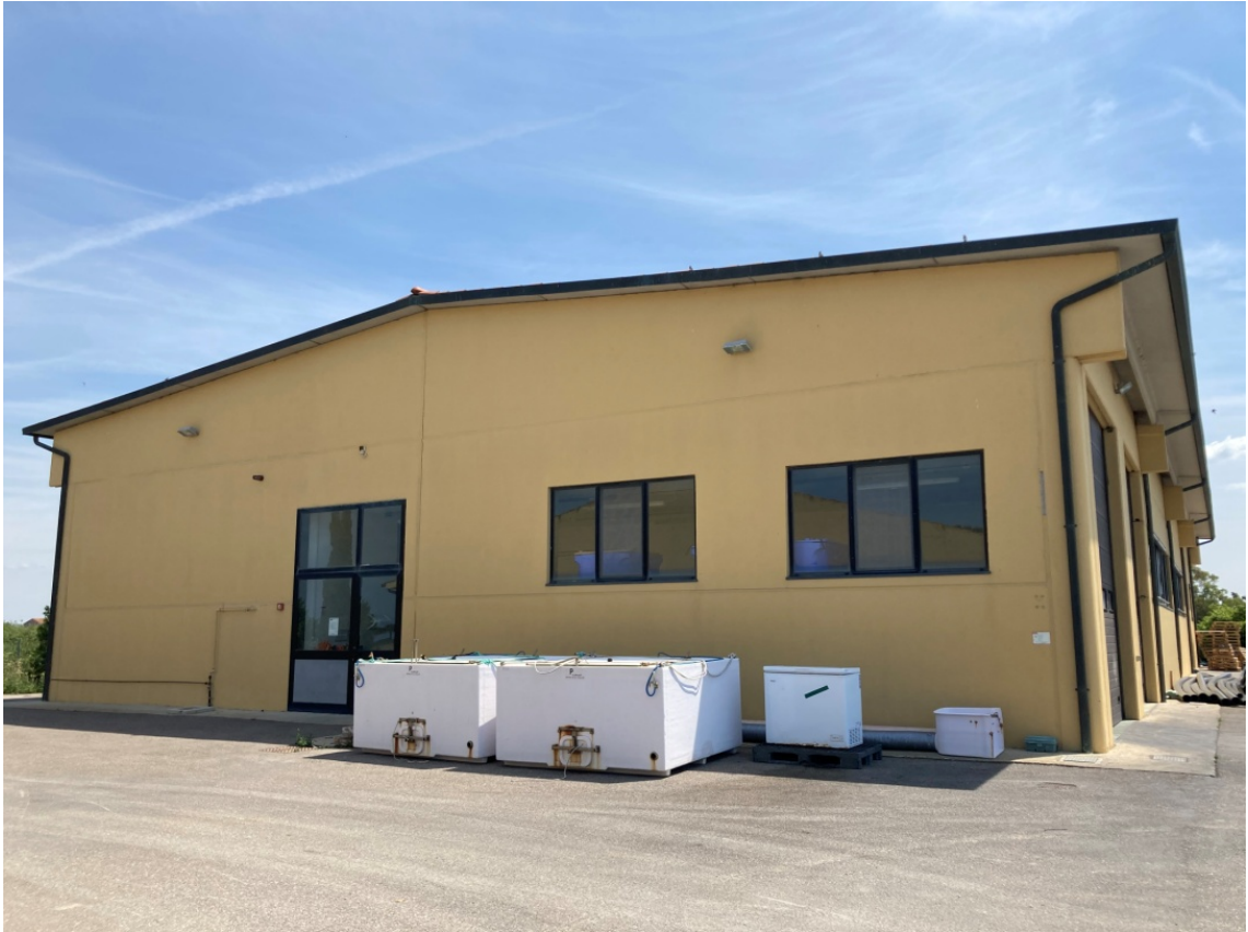
foto 7: capannone incassettamento del pesce (rif. 4) - vista da ovest