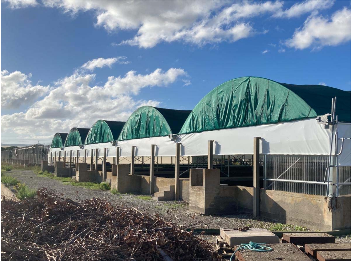
foto 13: vasche di allevamento attive (rif. 7) - vista da sud-est