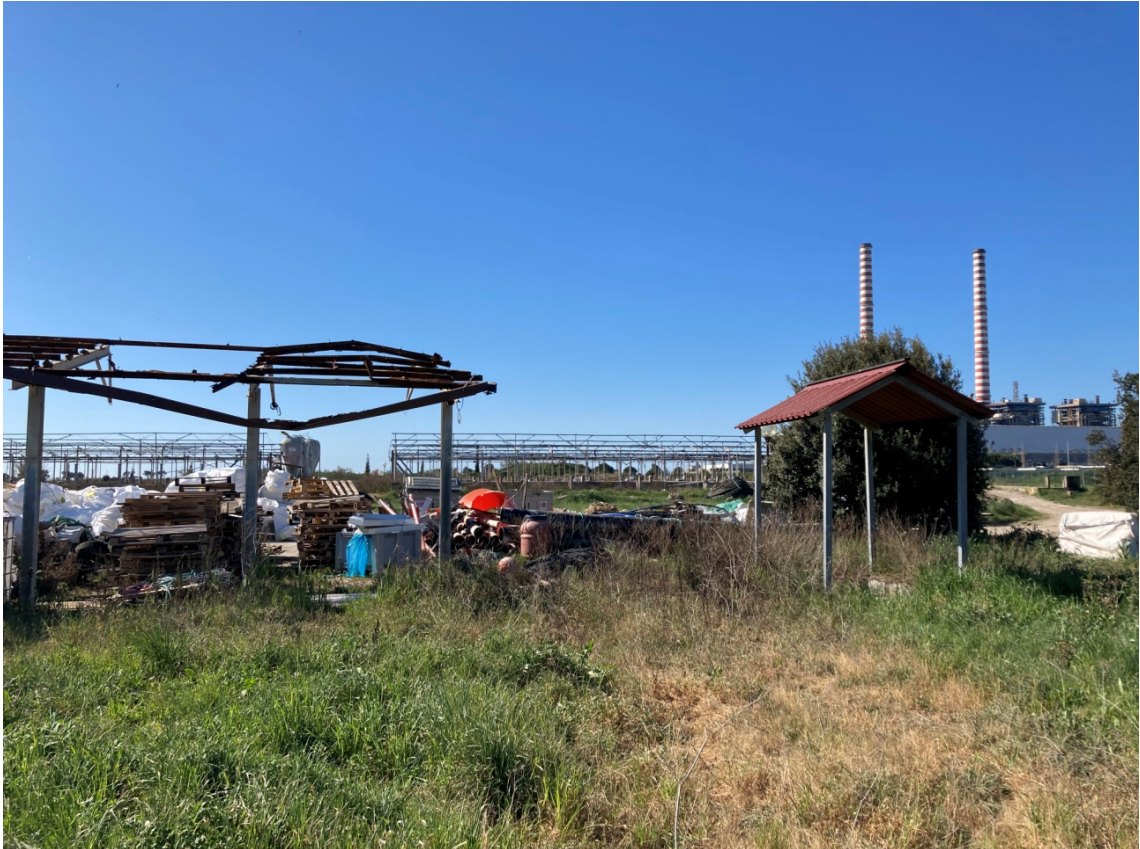
foto 21: costruzioni minori - deposito gasolio agricolo (rif. 28) - vista da nord-ovest