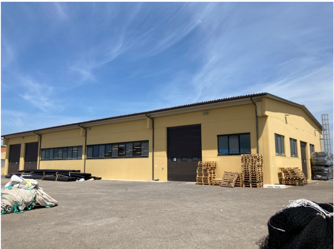
foto 8: capannone incassettamento del pesce (rif. 4) - vista da sud-est