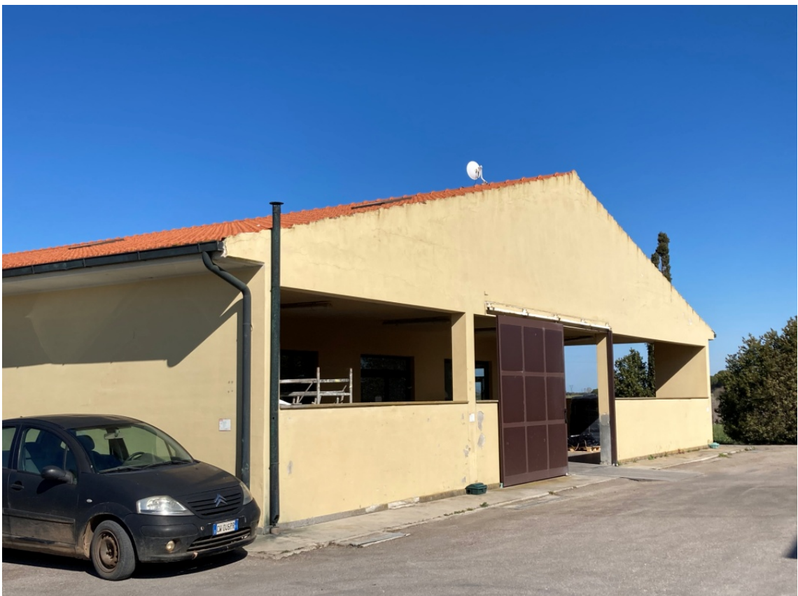
foto 6: uffici amministrativi e servizi al personale (rif. 3) - vista da sud-est