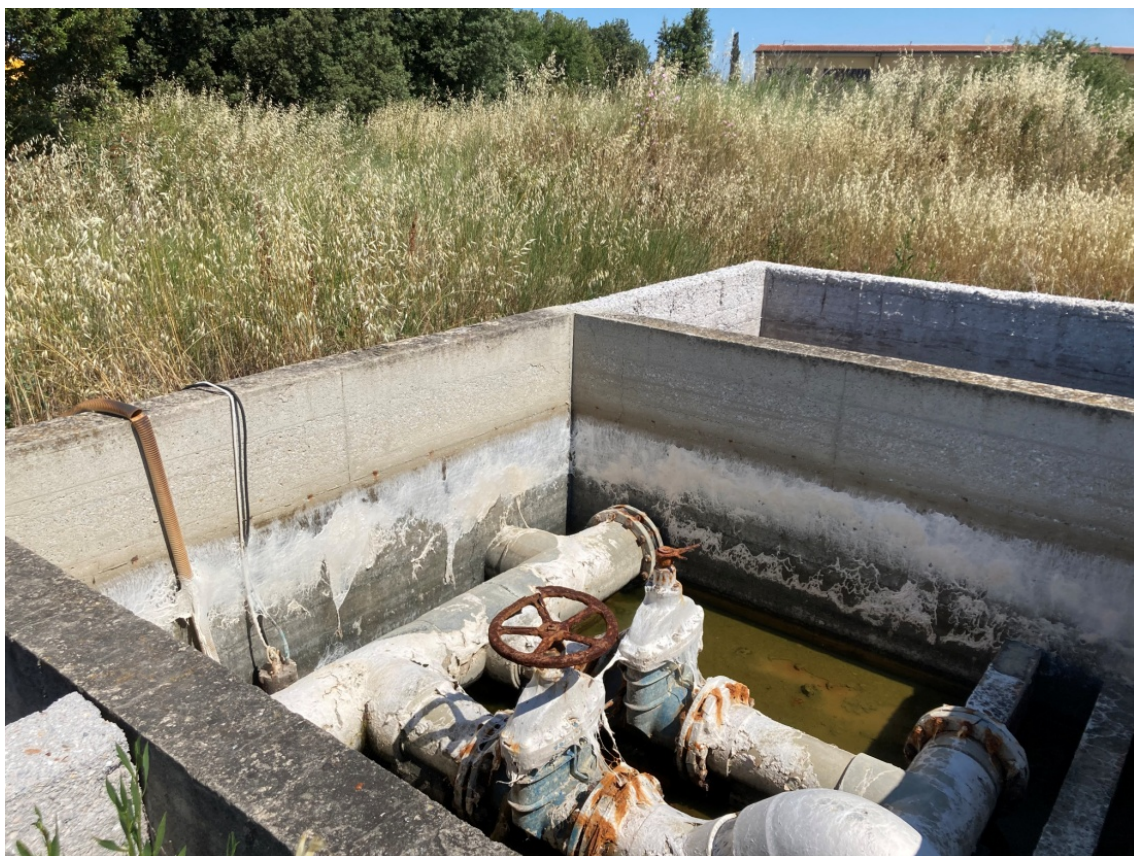
foto 19: costruzioni minori - cassoni unificazione tubazioni (rif. 14) - vista da sud