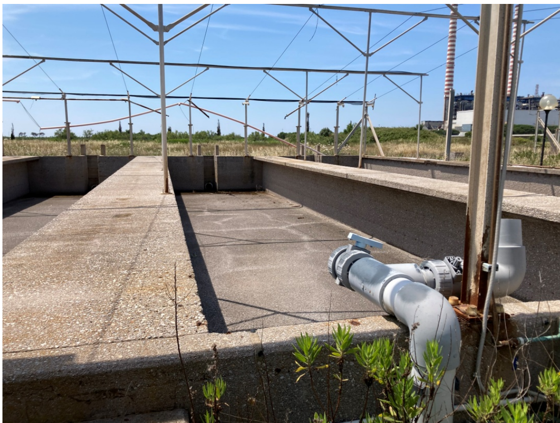
foto 11: vasche di allevamento in manutenzione (rif. 7) - vista da nord (particolare)