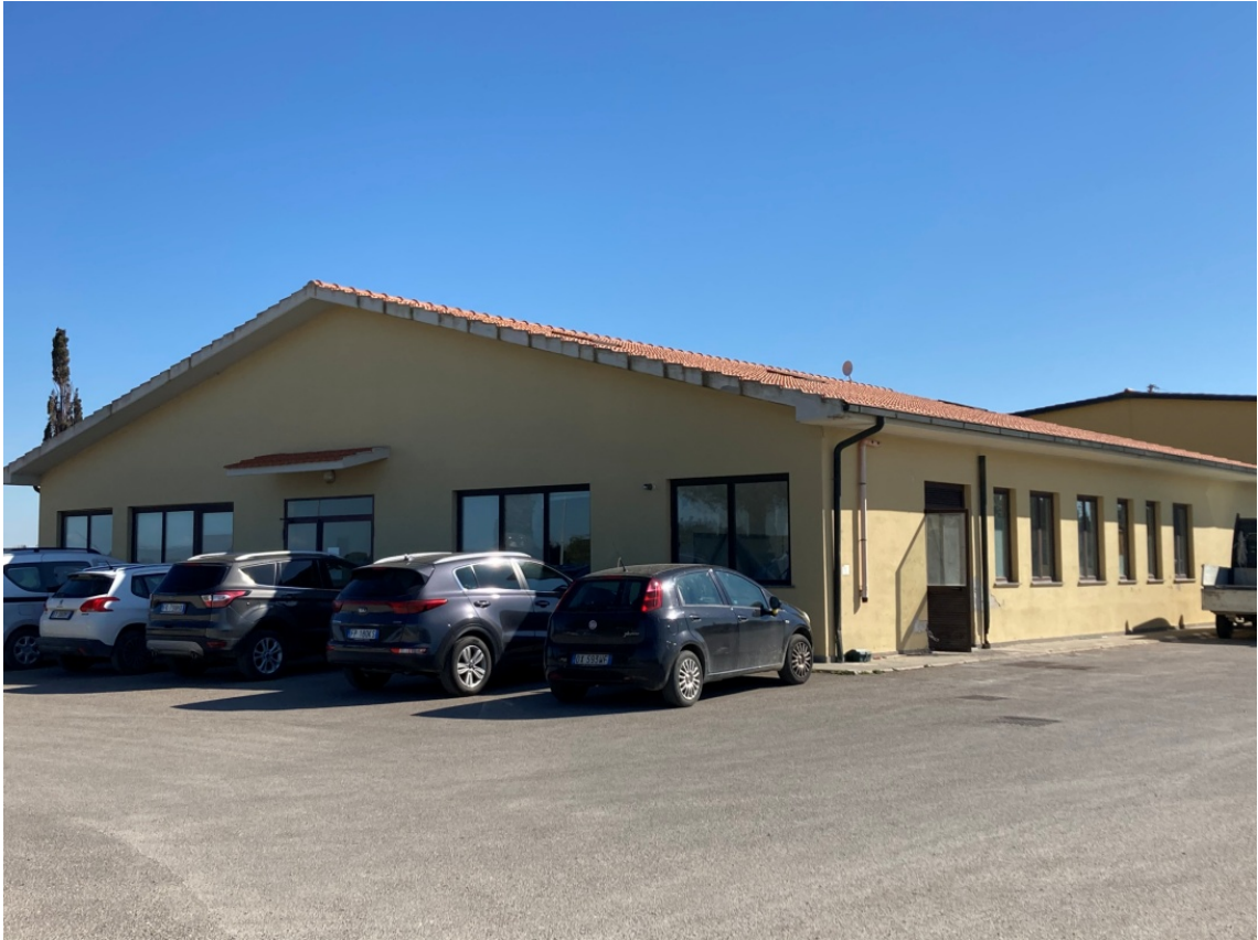
foto 5: uffici amministrativi e servizi al personale (rif. 3) - vista da sud-ovest