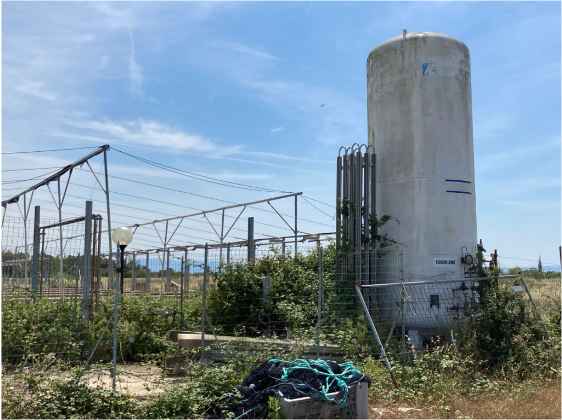
foto 17: costruzioni minori - deposito di ossigeno (rif. 12) - vista da nord-ovest