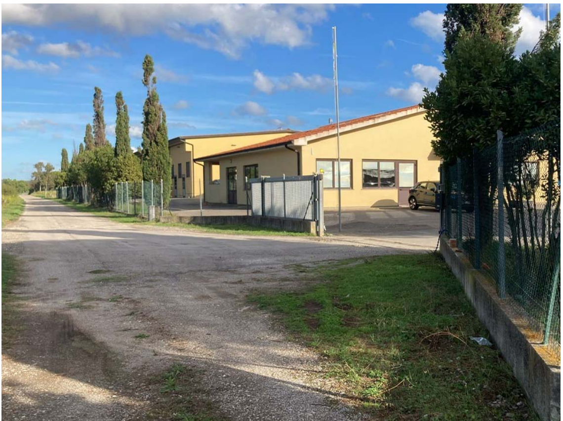
foto 22: strada di accesso e cancello d'ingresso all'impianto - vista da ovest