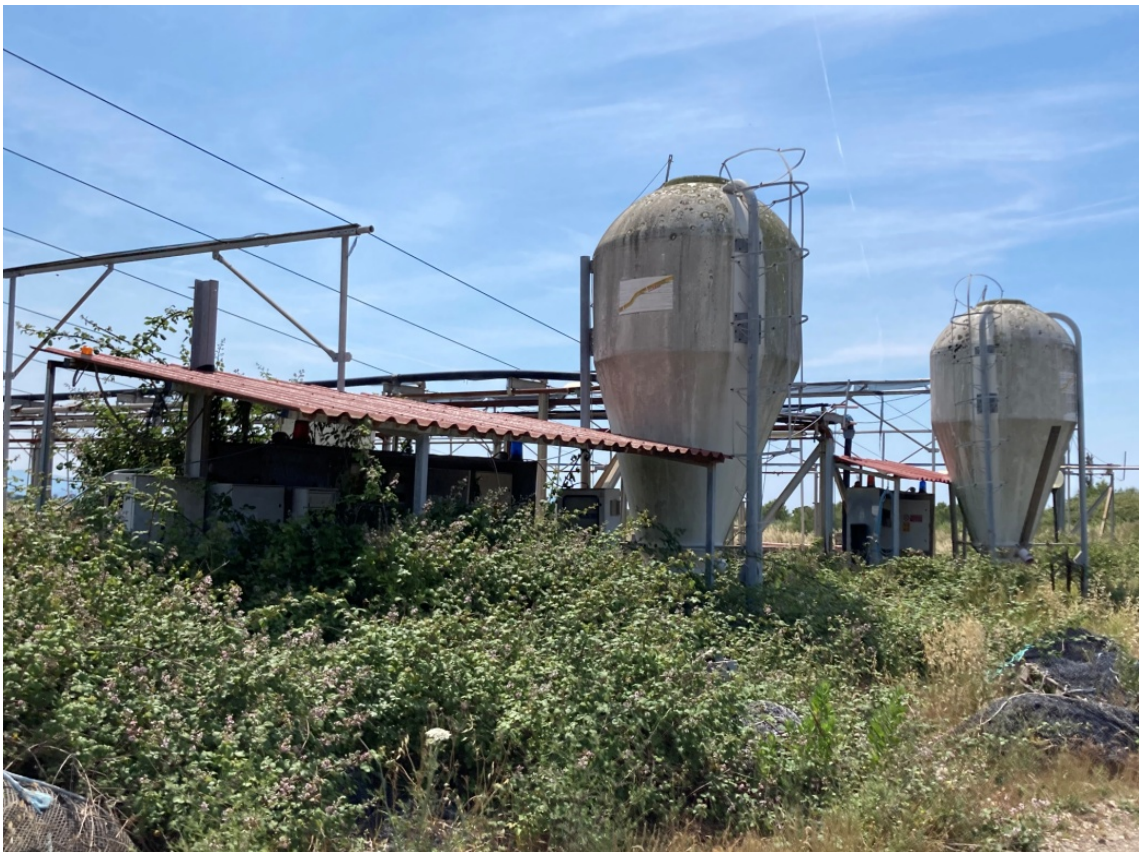
foto 16: costruzioni minori - deposito mangime (rif. 10) e tettoia quadri elettrici (rif. 11) - vista da nord-ovest