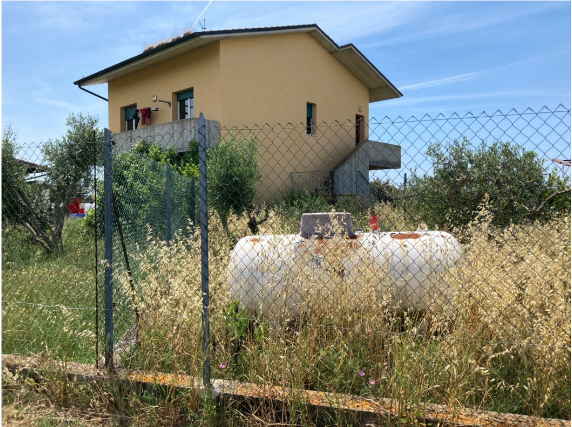
foto 15: costruzioni minori - deposito GPL (rif. 9) - vista da nord-ovest