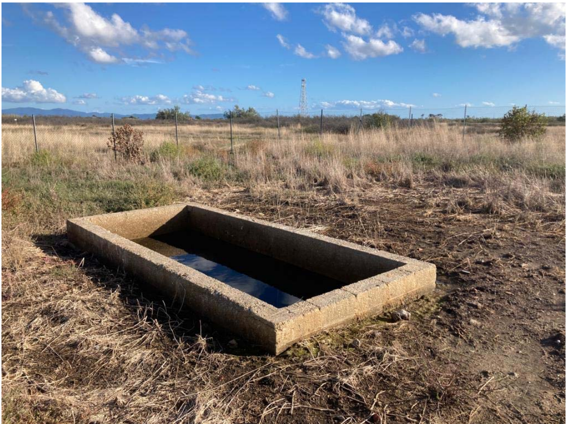
foto 18: costruzioni minori - cassoni unificazione tubazioni (rif. 13) - vista da ovest