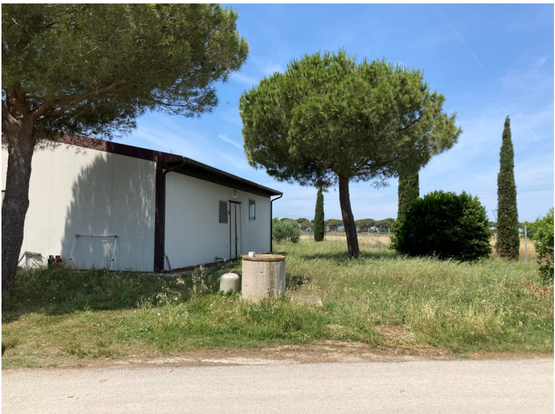
foto 14: costruzioni minori - pozzo ad anelli (rif. 8) - vista da est